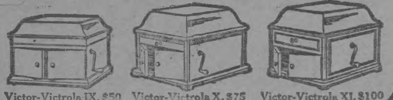
Victor-Victrola IX, $50