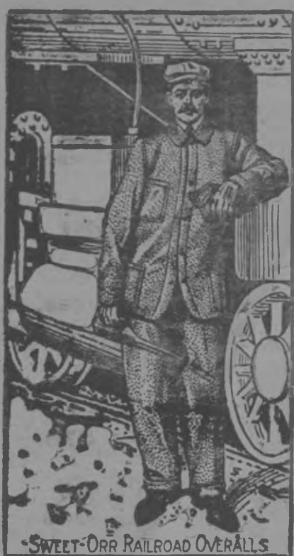
SWEET-ORR RAILROAD OVERALLS