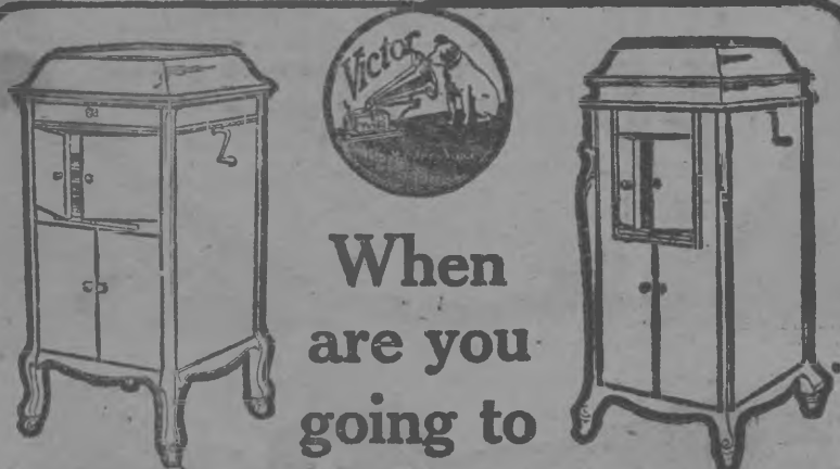
Victor-Victrola XIV $150